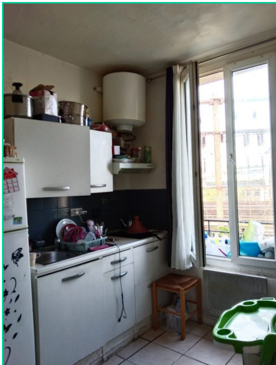
Cuisine ouverte sur le séjour